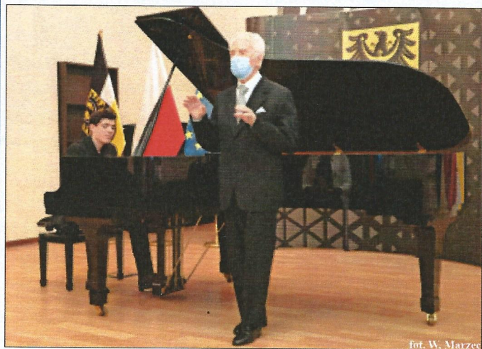
fol. W. Marzec