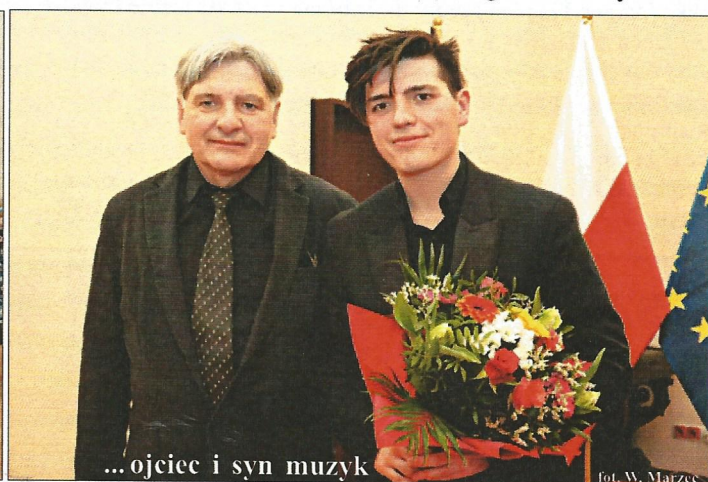
...ojciec i syn muzyk